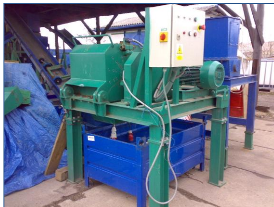
Speciální drtič - destruktor