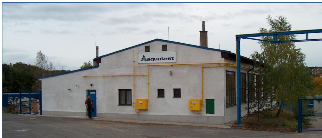
Provozovna – celkový pohled

Specializovaná provozovna společnosti AQUATEST a.s. se nachází v průmyslovém areálu Kovohutí v Mníšku pod Brdy a je určena k vývoji, testování a kompletaci recyklačních a sanačních technologií.