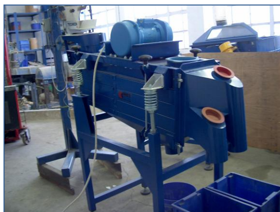
Vibrační třídiče ploštinové