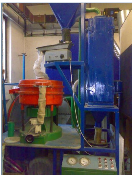
Allgaier – kruhové vibrační síto