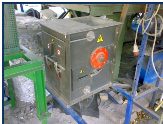
Magnetický bubnový separátor