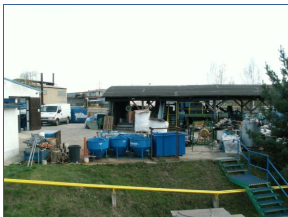
Provozovna – vnější prostory