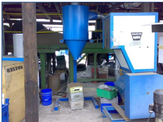
Nožový mlýn s odprášením