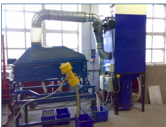
Suchý fluidní splav