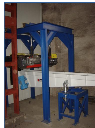
Bubnový drtič – výstup